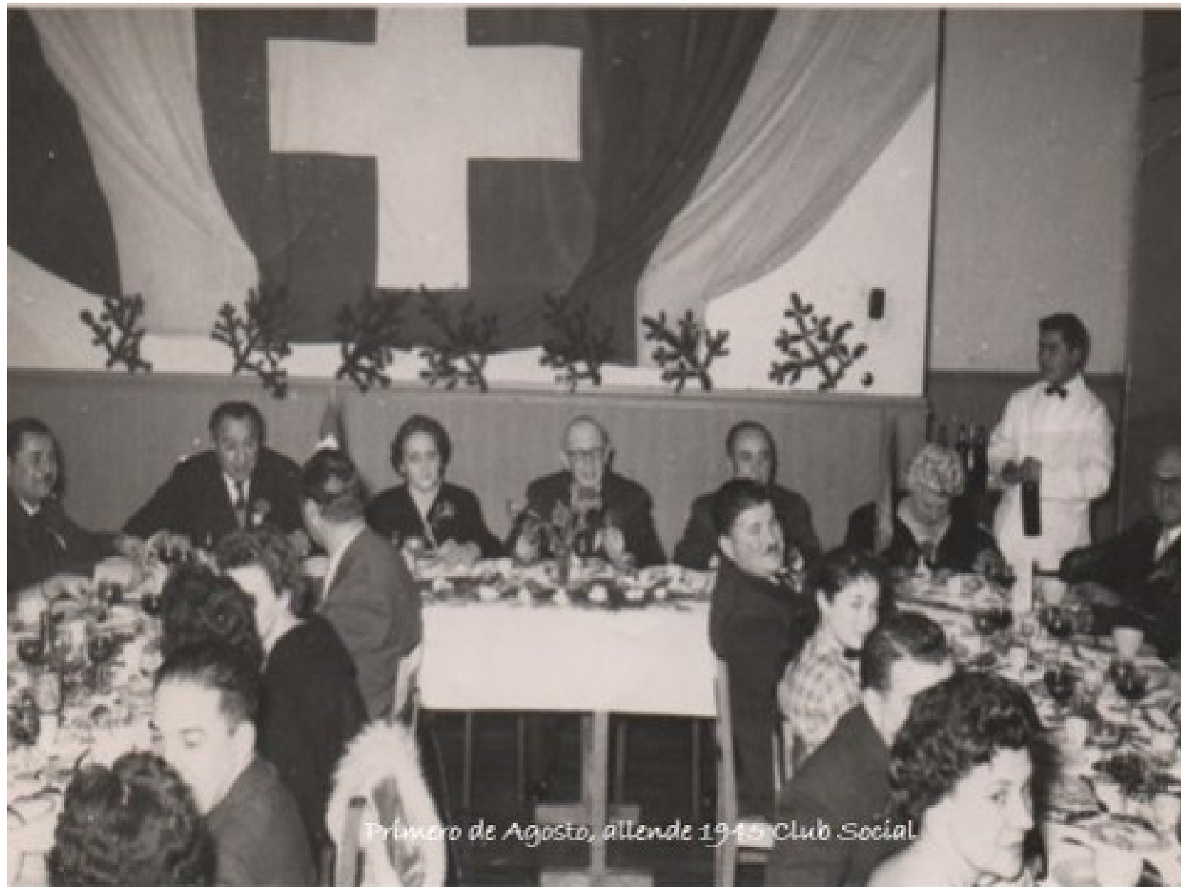
Primero de Agosto, allende 1945 Club Social