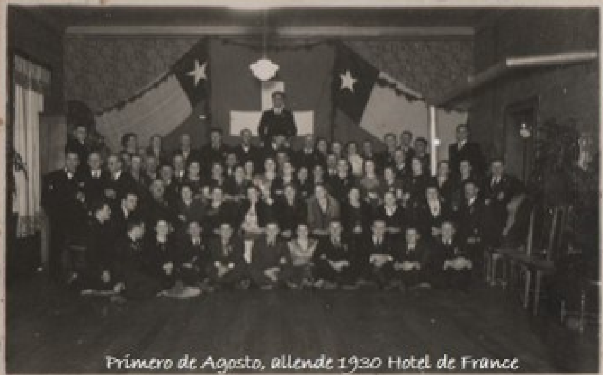
Primer de Agosto, allende 1930 Hotel de France