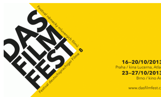
Photo: Offizielles Logo des Filmfests / Logo officiel Das Filmfest