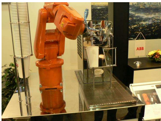
Photo: Roboter für Bierzapfen am Stand von ABB Robotik / Robot pour distributeur de bière au stand d'ABB Robotics