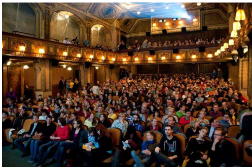
Photo: Ausverkaufter Kinosaal in der Lucerna / Salle à guichets fermés à Lucerna

Schon zum achten Mal konnte sich das Filmpublikum in Prag und in Brünn Ende Oktober an einer bunten Auswahl der aktuellsten und preisgekrönten Filme aus Deutschland, Österreich und der Schweiz erfreuen. Veranstalter waren die Schweizer Botschaft, das Goethe-Institut und das Österreichische Kulturforum in Prag in Zusammenarbeit mit den Prager Kinos Lucerna und Atlas und dem Brünner Kino Art.