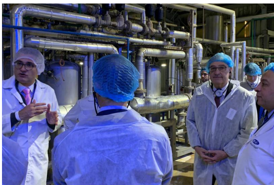
Visit of Federal Councillor Guy Parmelin at the Hero factory in Cairo