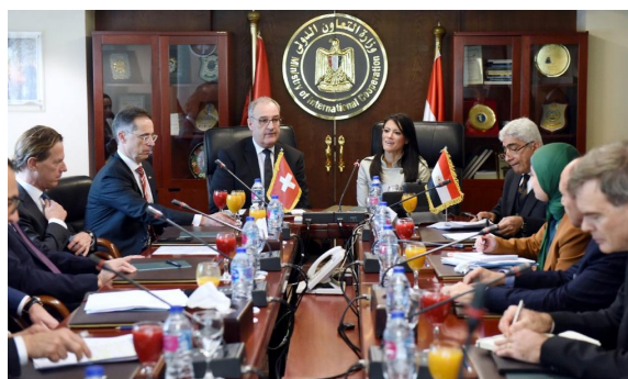
Bilateral meeting with Minister of International Cooperation Rania Al Mashat

Al Mashat expressed her appreciation for Switzerland's partnership in Egypt which has culminated in 700 million Swiss francs spent on development projects in the country since the start of development cooperation including in the fields of infrastructure planning, supply of potable water, health and environment. Federal Councillor Guy Parmelin also highlighted the celebration last year of 40 years of Swiss-Egyptian development cooperation and welcomed further cooperation in 2021-2024.