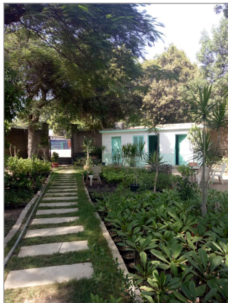
Swiss Cemetery in Cairo

hours per week. In order to become a board member you have to be a Swiss national. If you are interested to know more, you are invited to contact the club under info@swissclubcairo.com . The club management will connect you directly with current board members to answer your questions. We are looking forward to hearing from you soon!