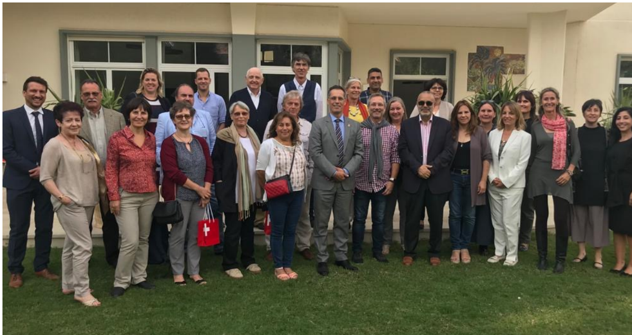
Warden-Meeting 2019 in der renovierten Residenz des Schweizer Botschafters