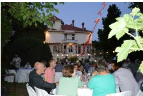
Gemütliche Stimmung im Garten der Residenz