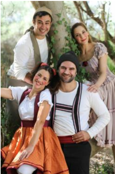
Χάιντι, της Johanna Spyri Heidi, by Johanna Spyri

Παρασκευή 18 Ιουλίου / ώρα έναρξης 21:30 /Ανοιχτό Θέατρο Κολινδρού/ Γενική είσοδος 6€ και Σάββατο 19 Ιουλίου / ώρα έναρξης 21:30 /Ανοιχτό Θέατρο Πάρκου Κατερίνης/ Γενική είσοδος 6€