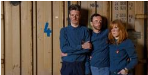
„Η σε ποιόν ανήκει ο κόσμος „Or to Whom Belongs the World“