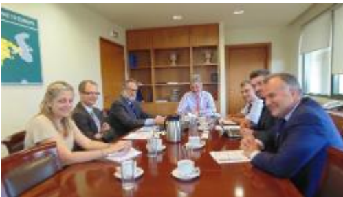
Rencontre dans le bureau du ministre de l'environnement, de l'énergie et du changement climatique, M. Yannis Maniatis