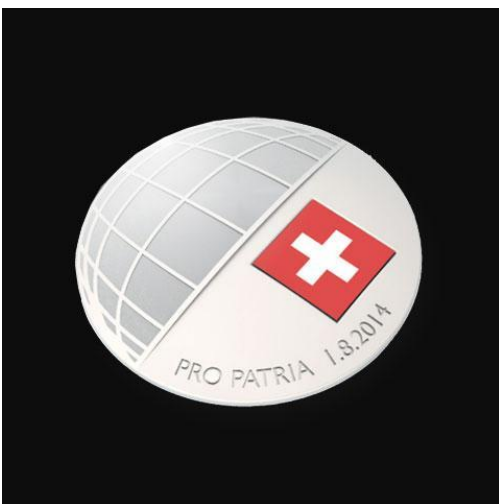
Das diesjährige 1. August-Abzeichen

Die Stiftung „PRO PATRIA Schweizerische Bundesfeierspende“ bezweckt, zum Gedenken an die Gründung der Schweizerischen Eidgenossenschaft, Sammlungen zur Förderung schweizerischer kultureller und sozialer Werke durchzuführen. Die Sammlungsergebnisse von jährlich rund drei Millionen Franken ergeben sich aus dem Erlös im In- und Ausland des traditionsreichen 1. August-Abzeichens und aus dem Verkauf der begehrten Pro Patria-Briefmarken. Das 1. August-Abzeichen ist 2014 der Fünften Schweiz gewidmet. Die darauf abgebildete Weltkarte steht für die Präsenz der Schweizer Mitbürger auf der gesamten Erde. Ein Teil des Erlöses der Pro Patria-Sammlung 2014 ist für die Schweizer Jugend im Ausland bestimmt.