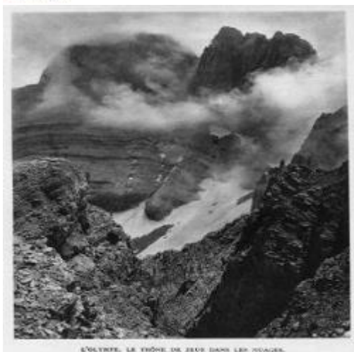
Φωτογραφία του Fred Boissonnas από τον Όλυμπο Fred Boissonnas' photo from Olympus

The Embassy of Switzerland is participating at one of the best-known and long-established Festivals of Greece at the foot of Mount Olympus with the following six art contributions: