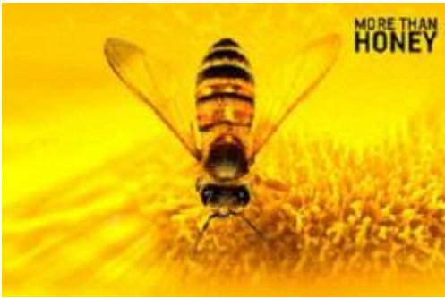
More than Honey, Markus Imhoof

Δευτέρα 7 Ιουλίου/ώρα έναρξης 20:30/Ανοιχτό Θέατρο Πάρκου Κατερίνης /στα γερμανικά με ελληνικούς υπότιτλους/ Είσοδος ελεύθερη