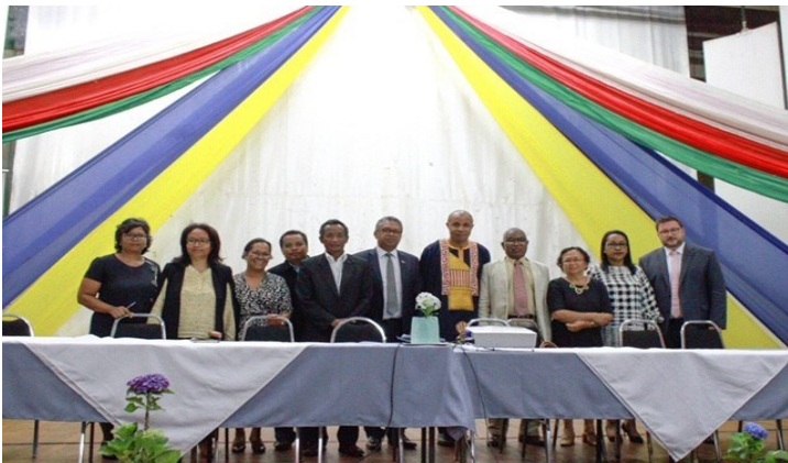
Les membres du panel avec l'Ambassadeur Chasper Sarott

Mardi 10 décembre, journée de la célébration des droits de l'homme, l'Ambassade de Suisse en partenariat avec le Haut-Commissariat des Nations unies aux droits de l'homme, le Festival International du Film des Droits de l'Homme et l'Université d'Antananarivo, a organisé la diffusion d'un film-documentaire intitulé « Chasseurs de Crimes », suivi d'un débat sur l'impunité à Madagascar. Les panelistes issus du Ministère de la Justice, du Haut-Commissariat aux droits de l'homme, de la Commission Nationale Indépendante des Droits de l'Homme, du Bianco, du Conseil Fampihavanana Malagasy, de l'Ordre des Avocats, de l'Ordre des Journalistes, de la Société civile représentée par Action des Chrétiens pour l'Abolition de la Torture et de la Faculté de Droit de l'Université d'Antananarivo se sont penchés sur la questions de la lutte contre l'impunité et ont répondu aux questions des nombreux étudiants présents ce jour-là.