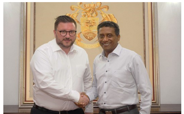
Après la cérémonie officielle à Victoria avec le Président de la République des Seychelles, Danny Faure

L'acceptation des lettres de créance est, de nos jours, presque systématique, grâce aux discussions préalables entre les deux États. Il arrive parfois que ces lettres de créances soient refusées ; dans ce cas l'ambassadeur du pays invité ne peut pas exercer ses fonctions.