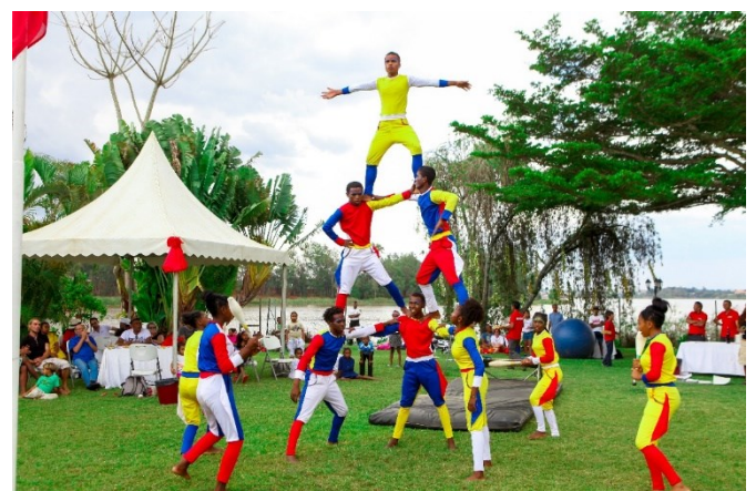
Cirque avec Graines de bitume

C'est toujours avec un immense plaisir que toute l'équipe de l'Ambassade accueille les familles suisses à cet événement.