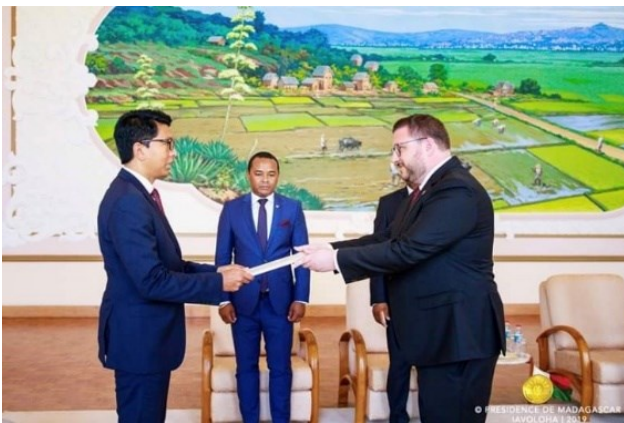
Remise des lettres de créance au Président de la République de Madagascar, Andry Rajoelina.