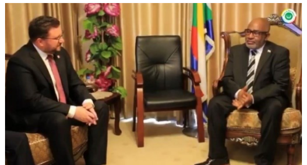
A Beit Salam avec le Président de l'Union des Comores, Azali Assoumani.