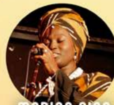
MARIARA SIGA SÉNÉGAL VENDREDI 5 AVRIL 18H00