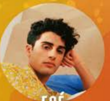
FOÉ FRANCE SAMEDI 6 AVRIL 18H00