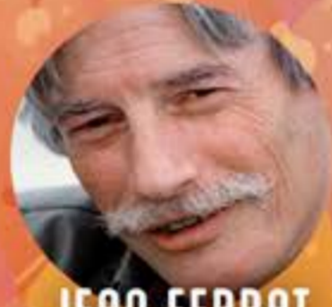
JEAN FERRAT CONCERT HOMMAGE FRANCE SAMEDI 6 AVRIL 15H00