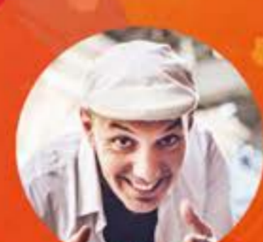
HH FRANCE SAMEDI 6 AVRIL 20H00