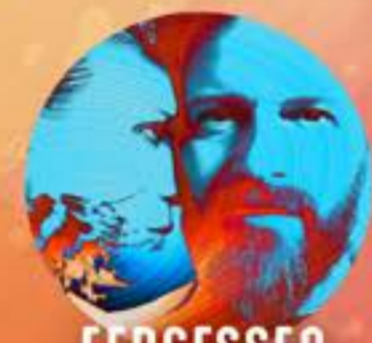
FERGESSEN CANADA VENDREDI 5 AVRIL 21H30