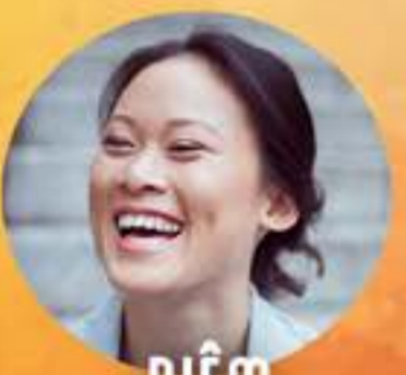
DIÊM FRANCE VENDREDI 5 AVRIL 20H00