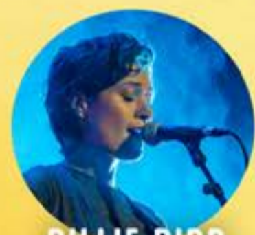
BILLIE BIRD SUISSE JEUDI 4 AVRIL 20H00