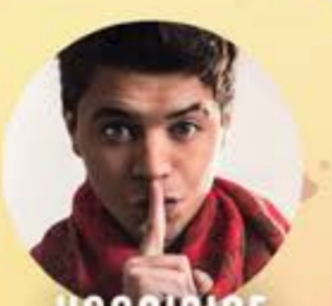
YANA SINE MAROC VENDREDI 5 AVRIL 20H00