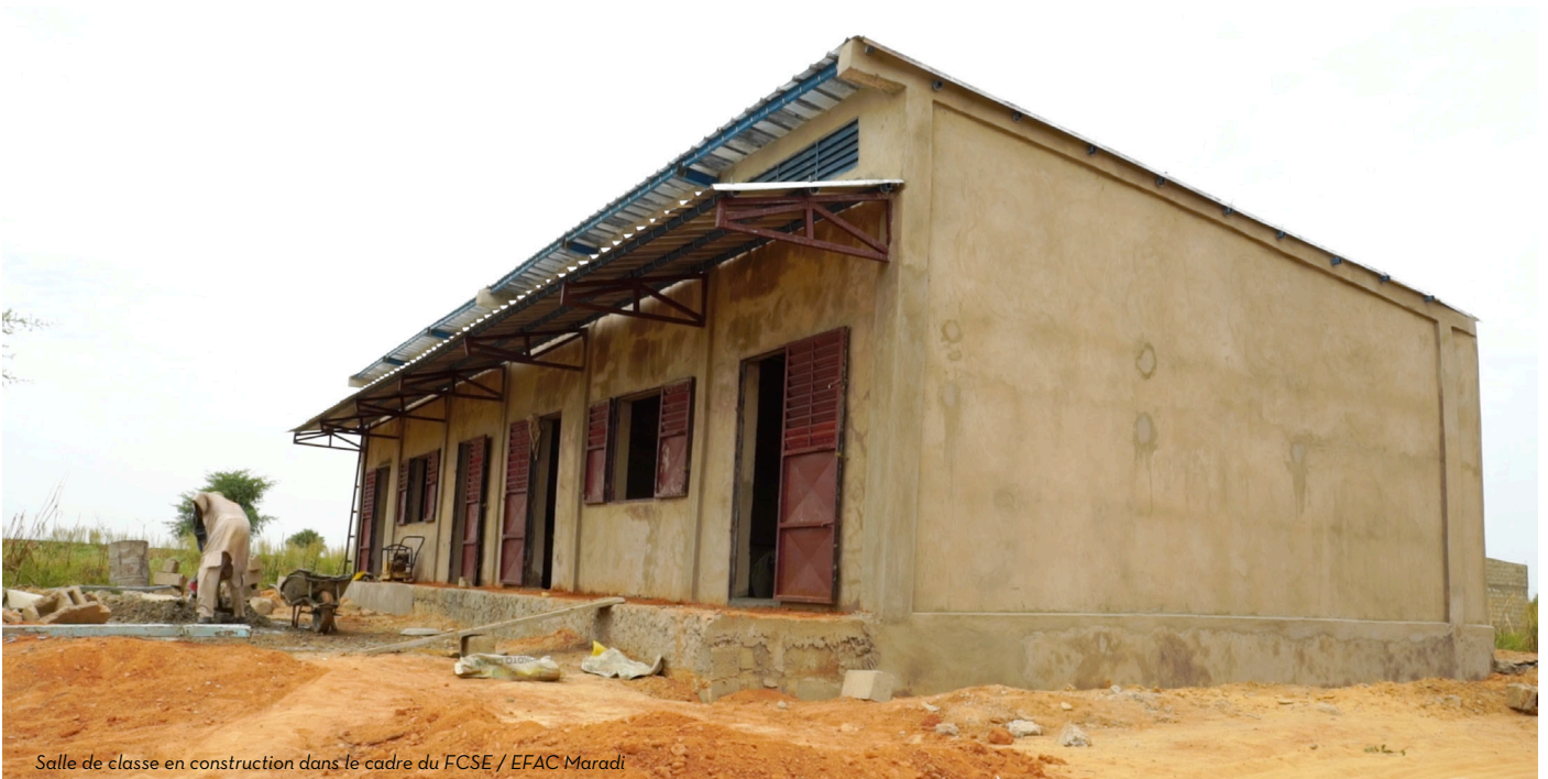
Salle de classe en construction dans le cadre du FCSE / EFAC Maradi

Aujourd'hui, les collectivités sont devenues les portes d'entrée et les acteurs centraux de la gestion du système éducatif. Elles signent les contrats pour le recrutement des enseignants contractuels, elles sont impliquées dans les activités des Comités de gestion décentralisée des établissements scolaires des enseignements primaires et secondaires (COGES/CGDES) et des Associations de Parents d'Élèves (APE). Les inspecteurs, conseillers et chefs de secteurs pédagogiques rendent compte aux maires de tout ce qui se passe au niveau de l'école. Les ressources canalisées via le FCSE ont permis de donner un coup d'accélérateur au processus de décentralisation. Ce qui responsabilise davantage les collectivités qui, désormais, construisent les classes là où le besoin est réel, répartissent les enseignants selon les besoins, confectionnent les tables-bancs et les mettent à disposition des établissements conformément à leurs programmations.