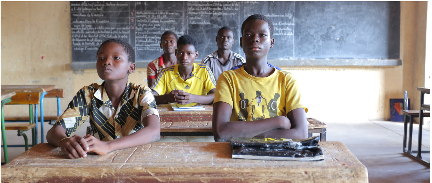
Élèves en situation de classe / Région de Maradi

Le gouvernement nigérien a pris, en 2016, deux décrets (075 et 076 du 26 janvier 2016) portant transfert des compétences et des ressources aux collectivités territoriales dans quatre secteurs parmi lesquels celui de l'éducation. La mise en place du Fonds Commun Sectoriel de l'Éducation (FCSE), d'un commun accord avec les partenaires, est venue donner un coup d'accélérateur au processus de décentralisation dans le domaine de l'éducation.