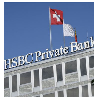
L'affaire « Swissleaks », impliquant la filiale genevoise de HSBC