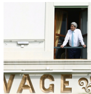
John Kerry à Lausanne, lors de négociations sur le nucléaire iranien

« Iran Nuclear talks: Behind the scenes at Lausanne » ( BBC )