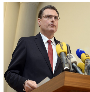
Thomas Jordan, président de la Direction générale de la BNS

« HSBC in Swiss tax avoidance storm » ( The Financial Times )