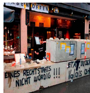
La nouvelle concernant la fermeture d'un restaurant de Zermatt contrevenant aux mesures de protection est également relayée dans la presse étrangère.

Beaux-Arts de Berne aurait mieux géré l'héritage d'une collection soupçonnée de contenir des œuvres spoliées.