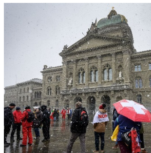
Les articles consacrés à la votation sur la loi COVID-19 laissent paraître un débat très polarisé.