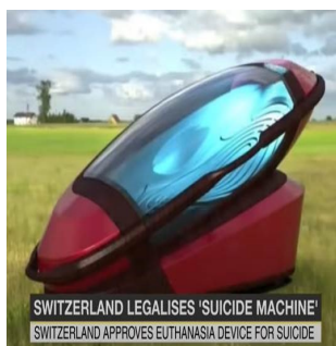
La « capsule suicide » Sarco

Il arrive régulièrement que certains sujets en lien avec la Suisse, bien qu'objectivement peu pertinents, suscitent une grande attention au niveau international. Il s'agit pour la plupart de sujets qui se caractérisent par une forte charge émotionnelle ou qui créent un effet de surprise. Au cours du quatrième trimestre 2021, la prétendue légalisation, en Suisse, d'une capsule pour le suicide assisté appelée Sarco, a rencontré un large écho.