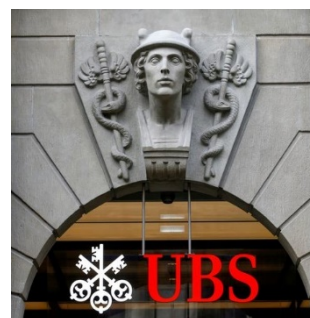
Les articles consacrés aux grandes banques suisses sont souvent illustrés par des images symboliques.