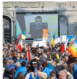
Le président ukrainien Zelensky en direct sur grand écran lors d'une manifestation organisée à Berne

de sa place financière, notamment le fait que la Suisse n'ait jusqu'à présent pas mis en place de système d'échange automatique d'informations avec de nombreux pays particulièrement concernés par le phénomène de la corruption.