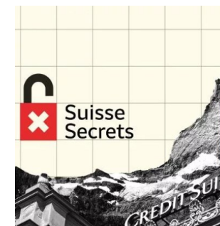
Les articles qui font paraître les médias associés aux enquêtes sur l'affaire « Suisse Secrets » arborent tous le même design.