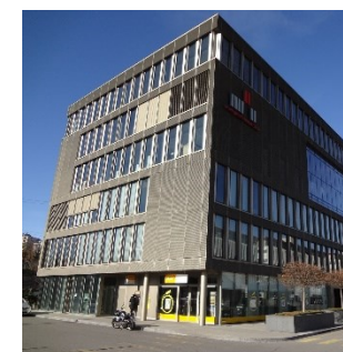
Les entrepôts de douane à Genève suscitent l'attention également car ils pourraient receler des valeurs patrimoniales d'oligarques russes.