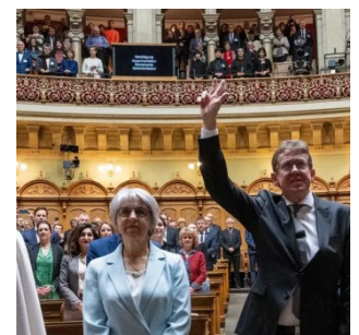
Élection des nouveaux membres du Conseil fédéral: des images de la cérémonie de prestation de serment accompagnent les articles.

Les médias étrangers se sont focalisés sur les particularités du système politique suisse, dont ils reconnaissent l'efficacité, mais qui selon eux atteste aussi d'une certaine faiblesse en temps de crise.