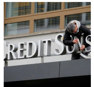
Cette photo publiée par le New York Times suggère les difficultés auxquelles fait face Credit Suisse.

Les sujets traités varient au cours du trimestre. La chute en bourse du titre Credit Suisse et les spéculations concernant les éventuelles conséquences que pourrait avoir la faillite de la banque sur les systèmes financiers internationaux ont fait couler beaucoup d'encre. La présentation de la nouvelle stratégie et l'entrée au capital d'investisseurs saoudiens ont été évoquées en long et en large par les médias du monde entier, le plus souvent sous un angle critique. De nombreux médias rappellent les scandales qu'a connus la banque par le passé et brossent ainsi un tableau de la situation générale. Les articles évoquent aussi de manière critique la convention judiciaire conclue par Credit Suisse pour des faits de blanchiment de fraude fiscale en France. Les médias focalisent leur attention clairement sur la banque, et non sur la Suisse et sa place financière de manière générale. Seul un petit nombre de commentateurs craignent des répercussions négatives sur la réputation de la place financière suisse.