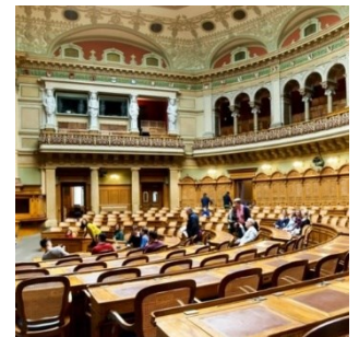
Les articles consacrés à l'élection des nouveaux membres du Conseil fédéral évoquent également le système politique suisse.

L'intérêt de ces derniers a surtout porté sur l'élection d'Élisabeth Baume-Schneider, présentée comme surprenante, dont l'arrivée a fait basculer la majorité du Conseil fédéral côté latin. Les réactions critiques de diverses organisations suisses de protection de l'environnement vis-à-vis de l'élection d'Albert Rösti ont également été relayées dans la presse. Les médias étrangers se sont focalisés sur les particularités du système politique suisse, dont ils reconnaissent l'efficacité, mais qui selon eux atteste aussi d'une certaine faiblesse en temps de crise.