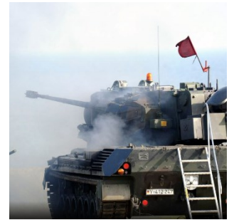
Les munitions pour les chars de défense anti-aérienne de type Gepard sont au centre de l'attention médiatique.

La question de la non-assistance à personne en danger est également évoquée. Durant plusieurs semaines, les médias allemands ont rapporté les déclarations de figures politiques allemandes, qui remettent en question une future collaboration de l'Allemagne avec la Suisse dans le domaine de l'armement. Dans la plupart des autres pays, le sujet est généralement traité de manière factuelle.