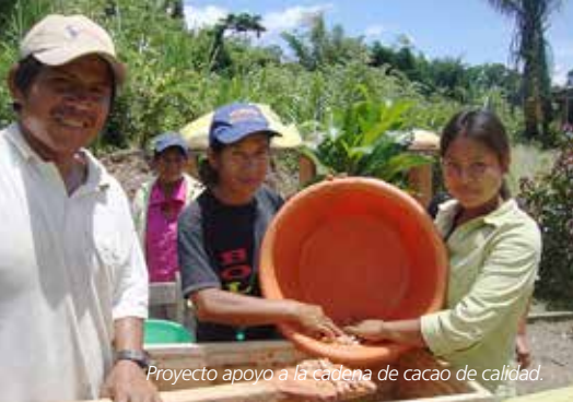
Proyecto apoyo a la cadena de cacao de calidad.