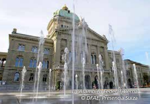
La Asamblea Federal, Berna