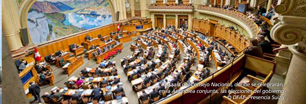
La sala del Consejo Nacional, donde se celebrarán, en la Asamblea conjunta, las elecciones del gobierno