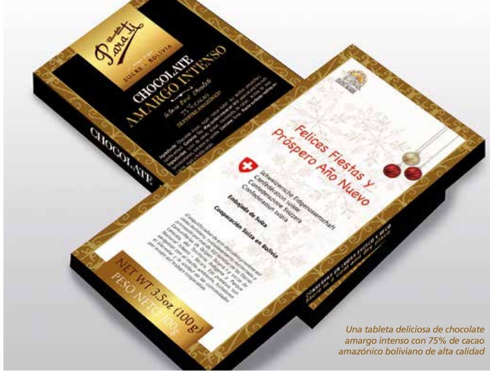
Una tableta deliciosa de chocolate amargo intenso con 75% de cacao amazónico boliviano de alta calidad