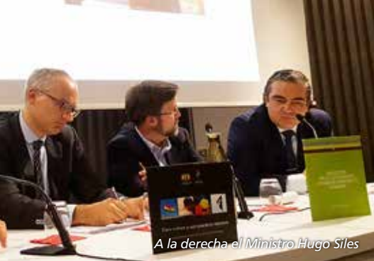
A la derecha el Ministro Hugo Siles