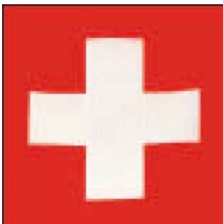
Illustration 2: drapeau national de la Suisse 1848–1889, avec la croix carrée

Photo: «Diebold-Schilling-Chronik 1513», propriété de la corporation Lucerne