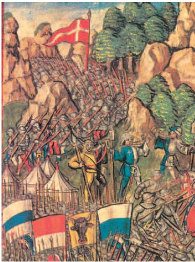
Illustration 1: «Schweizer Bilderchronik des Diebold Schilling», 1513. Bataille d'Arbedo, 30.6.1422

Photo: «Diebold-Schilling-Chronik 1513», propriété de la corporation Lucerne