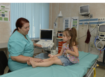
Die DEZA unterstützt Moldova darin, dass Kinder in allen Regionen des Landes die bestmögliche medizinische Versorgung erhalten.

schaffliche Entwicklung. Damit die Wirtschaft zum Nutzen aller nachhaltig wachsen kann, muss der Privatsektor seine Produktivität und Wettbewerbsfähigkeit steigern. In diesem Zusammenhang werden bestimmte Marktsysteme mit einem ganzheitlichen Ansatz beleuchtet, damit der Privatsektor ermöglicht wird zu wachsen sowie mehr und bessere bezahlte Jobs schaffen zu können.