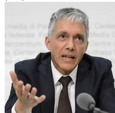
Michel Lauber, Procureur général de la Confédération