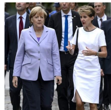
Rencontre à Berne entre Simonetta Sommaruga et Angela Merkel

« Switzerland offers Europe lessons on handling asylum seekers » ( Reuters )