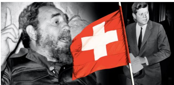
Le mandat de puissance protectrice de la Suisse vis-à-vis de Cuba

A l'occasion de la reprise des relations diplomatiques entre Cuba et les Etats-Unis, la fin du rôle de puissance protectrice joué par la Suisse depuis 1961 entre ces deux pays est évoquée par la presse étrangère (p.ex. Foreign Policy ). Bien que les projecteurs soient plutôt dirigés sur la réouverture des ambassades américaine à La Havane et cubaine à Washington, la médiation assurée par la Suisse jusqu'en 2015 donne lieu à des articles approfondis. Ceux-ci permettent de mettre en relief la Suisse des bons offices dans la presse internationale.