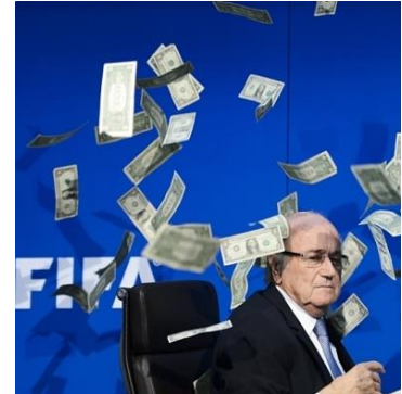
Sepp Blatter

engagée dans les actuelles démarches de régularisation des pratiques de la FIFA.