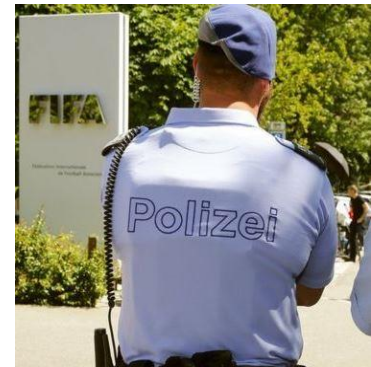
FIFA : demande d'extradition des USA