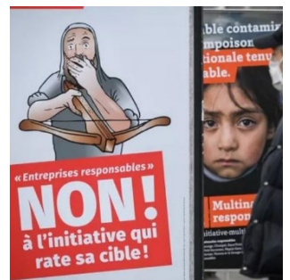
Affiche contre l'initiative «pour des multinationales responsables»