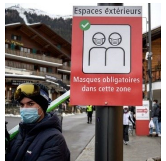
COVID-19: l'ouverture des stations de ski au centre de l'attention des médias