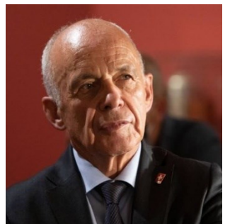
COVID-19: les déclarations du conseiller fédéral Ueli Maurer sont souvent commentées.