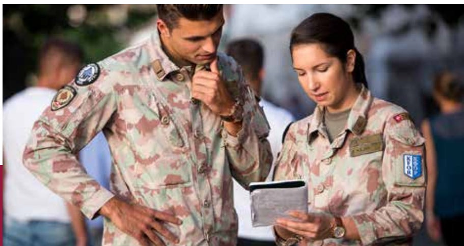
Membres d'une équipe de liaison et de surveillance (LMT) de l'Armée suisse, en patrouille à Prizren, Kosovo.

La Suisse continue à soutenir les réformes du secteur de la sécurité, qui tiennent compte des divers besoins en matière de sécurité, comme la protection contre les violences commises dans la rue par des bandes armées, la protection contre la violence domestique ou encore la traite des êtres humains.