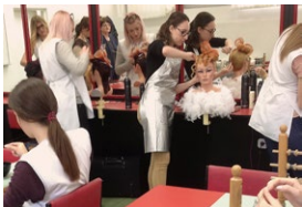
Una formazione professionale più moderna migliora le possibilità di occupazione dei giovani.

In Croazia la Svizzera sostiene, nel periodo 2015–2024, dieci progetti con un contributo di 42,75 milioni di franchi. A fine 2020 erano stati raggiunti i seguenti risultati.