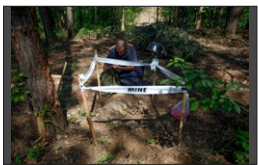
Grazie al progetto di sminamento in Croazia, la Svizzera crea un ambiente sicuro e protetto per la popolazione che vive nelle regioni minate.

Oggi molti abitanti raccolgono le acque reflue in fosse settiche, che possono essere vasche in calcestruzzo interrate oppure semplici fosse scavate nella terra, da cui l'acqua viene regolarmente pompata. Nella regione del Gorski Kotar, nel Nord-Ovest della Croazia, la Svizzera fornisce supporto a tre Comuni (Delnice, Fužine e Brod Moravice) nella costruzione e nel risanamento delle infrastrutture idriche e di scarico. I lavori di costruzione, che si svolgono in modo scaglionato, sono stati avviati nel novembre del 2018.