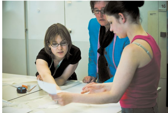
Una delegazione croata in visita presso diversi istituti di formazione professionale e aziende formatrici di vari settori, per osservare di persona il funzionamento del sistema svizzero di formazione duale.