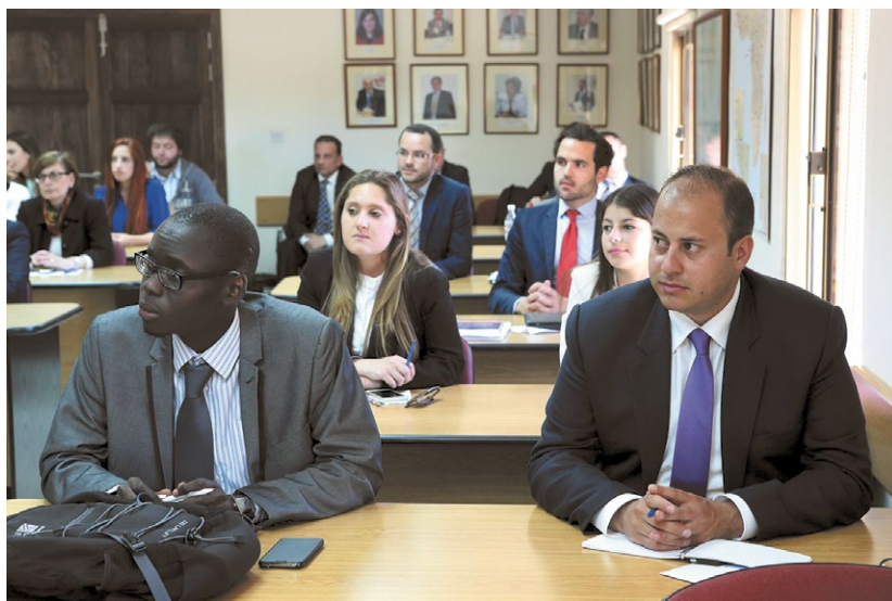
Una sessantina di giovani diplomatici provenienti dal Nord Africa e dal Medio Oriente hanno acquisito conoscenze importanti in materia di diritti umani, democrazia e governance frequentando un corso di master alla Mediterranean Academy of Diplomatic Studies (MEDAC).

60 giovani diplomatici provenienti dal Nord Africa e dal Medio Oriente hanno potuto, grazie a borse di studio, acquisire conoscenze importanti in materia di diritti umani, democrazia e governance frequentando un corso di master. Una rete di ex studenti della MEDAC permette di approfondire le conoscenze personali reciproche e, indirettamente, di rafforzare la collaborazione tra i Paesi del Mediterraneo. L'istituzione di una cattedra svizzera ha consolidato le relazioni di partenariato tra Svizzera e Malta e ha permesso a docenti svizzeri di insegnare alla MEDAC in qualità di ospiti. Nel quadro del contributo svizzero, la MEDAC ha beneficiato di un finanziamento di 1,9 milioni di franchi. La collaborazione tra i due Paesi prosegue anche ora che il progetto è terminato.