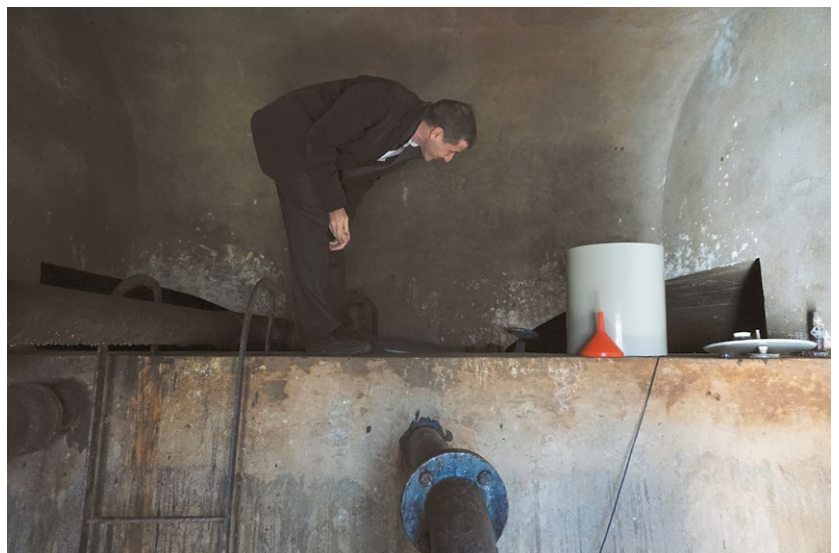
Uno specialista svizzero esamina un serbatoio di acqua potabile costruito nel 1960 nel comune croato di Fužine.