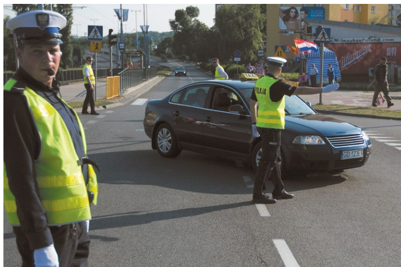
Più di 600 agenti delle forze di polizia polacche hanno ricevuto una formazione in materia di sicurezza stradale, con l'obiettivo di migliorare l'efficienza e l'efficacia della sorveglianza del traffico.

Il 6 febbraio 2015, il Parlamento polacco ha emanato una versione riveduta della legge sul traffico stradale, entrata in vigore nel maggio 2015. Per la stesura della nuova normativa, il legislatore polacco ha preso spunto dalla Svizzera. Ora per i reati stradali sono previste multe disciplinari più elevate, e in caso di tasso alcolemico eccessivo vengono applicate sanzioni più severe. Anche l'aiuto alle vittime istituito in Polonia si basa sul modello applicato in Svizzera. Ora se un conducente in stato di ebbrezza causa un incidente, è tenuto per legge a risarcire la vittima o la famiglia della vittima oppure a versare il risarcimento a un fondo per l'aiuto alle vittime. La revisione della